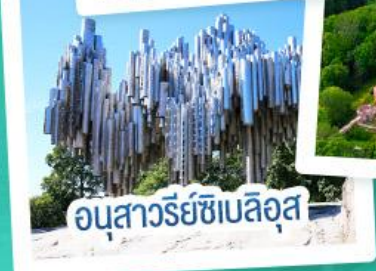
อนุสาวรีย์ซีเบลอุส

ฟินแลนด์ - เอสโตเนีย - ลัตเวีย - ลิทัวเนีย แวะเที่ยวเซี่ยงไฮ้