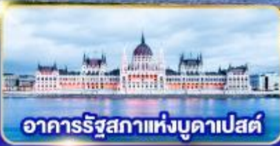
อาคารรัฐสภาแห่งบูดาเปสต์