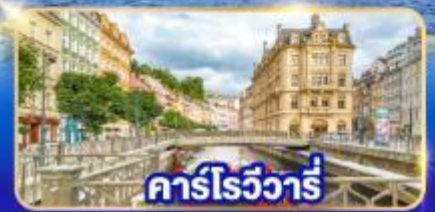
คาร์โรวัวร์