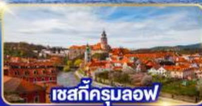
เชสกีครุมลอฟ