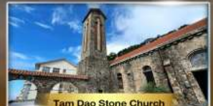
Tam Dao Stone Church