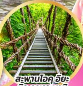
สะพานโอคุอียะ นิจู คาซุระบาช