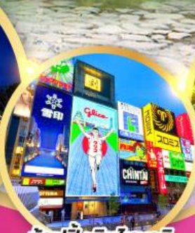
ช้อปปิ้งชินโซบาช