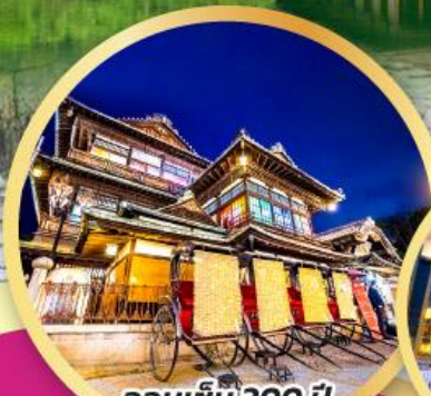
ออนเซ็น 300 ปี โตโจ ออนเซ็น