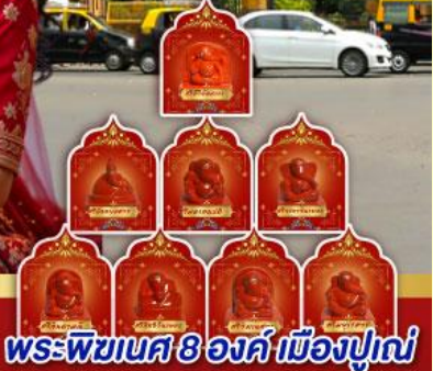
พระพิฆเนศ 8 องค์ เมืองปูणे