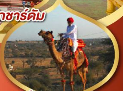
ฟรี ขี่อูฐ เมืองมันทอวา ราคาเริ่มต้น