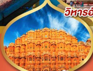
พระราชวัง สายลม