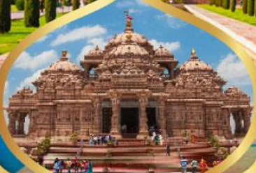
วิหารอักซาร์ดีม