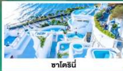
ซาโตรินี่