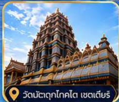
วัดมัตตุกโกโต เซดเตียร์