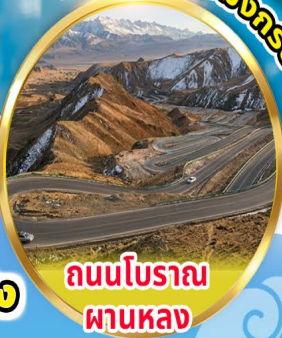
ถนนโบราณ ผานหลง