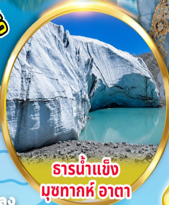
ธารน้ำแข็ง มุขทากห์อาตา