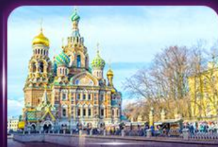
โบสถ์แห่งหอยดิลีอด