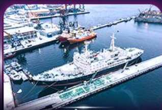
เรือตัดน้ำแข็งเลนิน