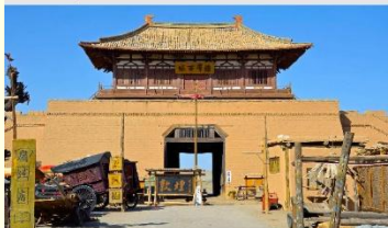
เมืองโบราณตุนหวง