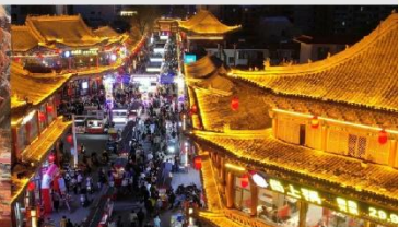
ตลาดกลางคืนจางเย่

*ทางบริษัทฯ ขอสงวนสิทธิ์ในการสลับโปรแกรมทัวร์ตามความเหมาะสมขึ้นอยู่กับสถานการณ์หน้างาน โดยคำนึงถึงผลประโยชน์ของลูกค้าเป็นสำคัญ