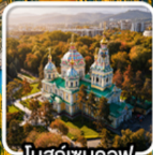
โบสถ์เซนคอฟ

นั่งกระเช้าคอนโดล่าขึ้นสู่ชิมบูลัก สตรีสออร์ก ไร่มุกแห่งเทือกเขาเทียนชาน ทะเลสาบโคลโซ หุบเขาเจดี โอกูซ / ภูเขาหินเทพนิยาย / ทะเลสาบอีสซิกกุล ชมการแสดงการล่าเหยื่อของนกอินทรี