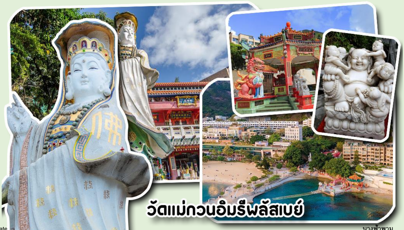
วัดแม่กวนอิมริพลัสเบย์

จากนั้นพาท่านเดินทางไปนมัสการ เจ้าแม่กวนอิมริมหาดริพลัสเบย์ วัดแห่งนี้ถูกสร้างขึ้นเพื่อคุ้มครองชาวประมงเวลาออกเรือไปหาปลาในสมัยก่อน บริเวณวัดมีสิ่งศักดิ์สิทธิ์มากมาย ได้แก่ เจ้าแม่กวนอิม ประดิษฐานอยู่ทางด้านซ้ายของวัด ซึ่งผู้คนนิยมเดินทางไปกราบไหว้ขอพรเรื่องการมีบุตร และยังมีพระสังกัจจายที่เชื่อกันว่าสามารถขอเพศของบุตรที่จะมาเกิดได้ โดยหลังจากกราบไหว้แล้วก็ให้ลูบที่ท้องของพระสังกัจจาย ถ้าอยากได้ลูกชายให้ลูบท้องซ้าย อยากได้ลูกสาวให้ลูบท้องขวา ถัดมาคือ เจ้าแม่ทับทิมเทพีแห่งท้องทะเล ท่านจะคอยคุ้มครองผู้เดินทางทางเรือ หรือผู้ที่เดินทางไปไหนมาไหนท่านจะคอยคุ้มครองให้ปลอดภัย และมีโชคลาก ถัดจากบริเวณที่กราบไหว้ขอพร ก็จะมีศาลาแปดเหลี่ยมริมน้ำ และสะพานเล็กๆ ที่ชื่อว่าสะพานต่ออายุ ซึ่งเชื่อกันว่าหากเดินข้ามสะพานแห่งนี้ 1 ครั้ง ก็จะมีอายุยืนขึ้น 3 ปี