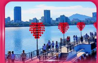
สะพานแห่งความรัก