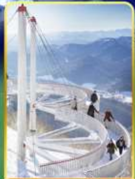
ระเบียงหมอกน้ำแข็ง