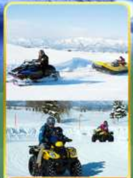
BIBAI SNOW LAND