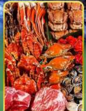
ปิ้งย่างพรีเมียมมันตะ

ออนเซ็น 2 คั้น มน.กระเป๋า 1 ใบ 23 กก 7Days 5Night