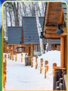
มิตซูบิชิ