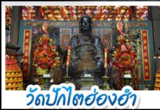
วัดบิกิตฮองฮำ