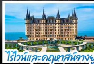
ไร่ไวน์และคฤหาสน์นางยู