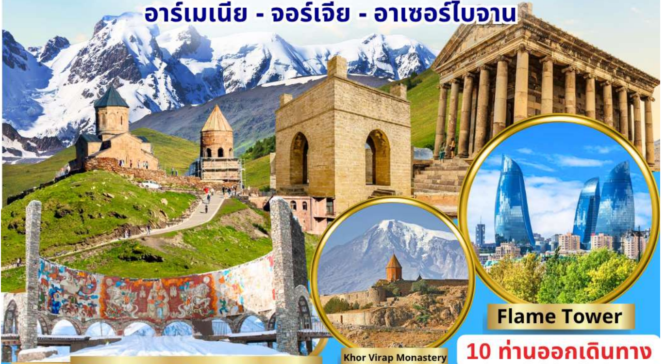
Georgian-Russian Friendship Monument