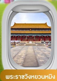
พระราชวังหยวนหมิง