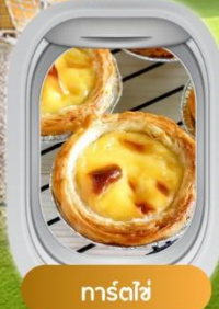
ทาร์ตไข่