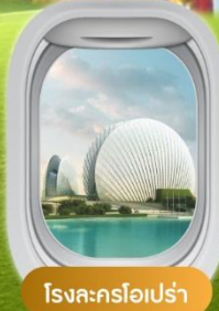
โรงละครโอเปร่า