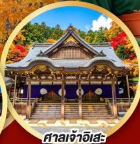
ศาลเจ้าฮิสะ