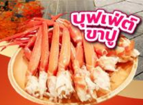
บุฟเฟ่ต์ ซาซู