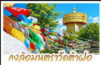
วงล้อมนตราวัดต้าฟอ

ถ่ายรูป MOOD ที่ไซท์วิวทะเลสาบเอ๋อร์ไห่สุดโรแมนติก • ชมดอกไม้ตามฤดูกาลกลางขุนเขา ณ สวนฮวาปูฉาง พืชดอกเขาคิมะมิงกรหยกความสูงกว่า 4,506 เมตร (รวมกระเช้าใหญ่ ไป-กลับ) • บึงรถไฟชมวิวภูเขาหิมะมังกรหยก ชมวิวแบบพาโนรามา • เที่ยวเมืองโบราณต้าหลี่ ลี้เจียง แซงกริลล่า ซิม ซ้อป สะ กับวัฒนธรรมยูนนานทิเบต ชมธารน้ำขาวไปสู้อยู่ไกล UNSEEN เมืองจินหน่งยูนนาน • วัดลามะซงจ้านหลิน สัมผัสกลิ่นอายอารยธรรมทิเบต วิวพรทิวกับล้อมนคราที่ใหญ่ที่สุดในจีน • ซ้อปิ้งเพิลิน ณ ถนนคนเดินหนานผิงเจีย & POP MART