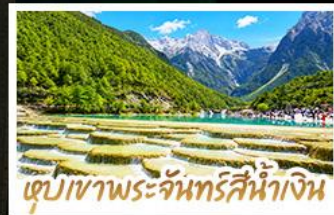
เขื่อนเขาพระจันทร์สีน้ำเงิน