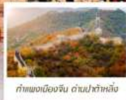
ท่าแพงเมืองจีน ด่านป่าต้าหลิ่ง