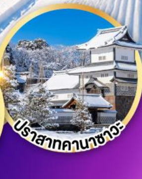
ปราสาทคานาซาวะ