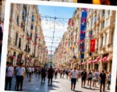
ISTIKLAL STREET (Grand Avenue of Pera) ถนนสายช้อปปิ้ง ยืน 88 ครบรอบในทีเดียว