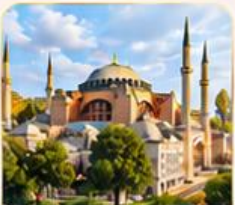
HAGIA SOPHIA โบสถ์เซนต์โซเฟีย