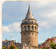
GALATA TOWER หอคอยกาลาตา