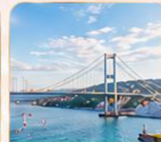
BOSPHORUS STRAIT ช่องแคบบอสฟอรัส