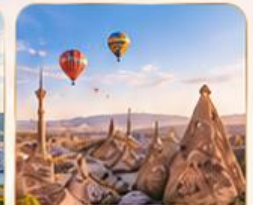
CAPPADOCIA คัปปาโดเกีย