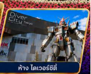
ห้าง ไคเวอร์ซิตี