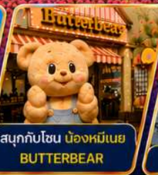
สนุกกับโซน น่องหมีเนย BUTTERBEAR