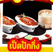
เปิดปิ้งกั๊ง