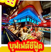
บูฟเฟต์ซีฟู้ด