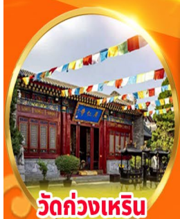
วัดกวางเหริน