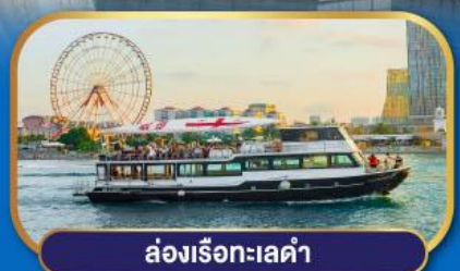
ล่องเรือทะเลดำ