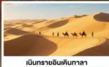
เป็นกรายอินเคินกาลา