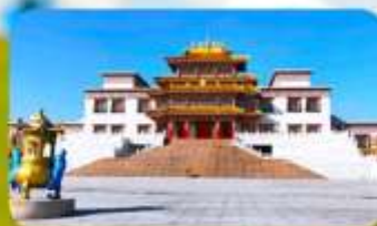
คฤหาสน์พุทธบูชาแห่งชีวีคูลาน