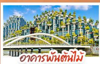
อาคารพันสถานี