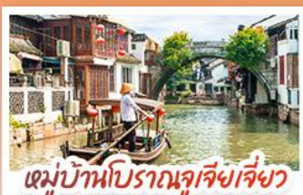
หมู่บ้านโบราณจูเจียงเจี๋ยว

สวนสนุกเซี่ยงไฮ้ดิสนีย์แลนด์ เต็มวัน (รวมรถรับ-ส่ง)