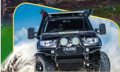
คันรถ 4WD สู้อีกกลางเทือกเขาคอเคซัส