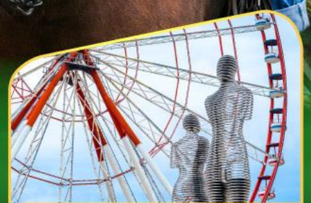
อนุสาวรีย์อาลีและนีโน่