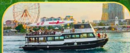
ล่องเรือทะเลดำ