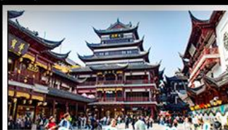
ตลาดร้อยปีเจิ้งหวงเหมียว