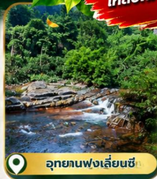
อุทยานฟ่งเลี่ยนซี