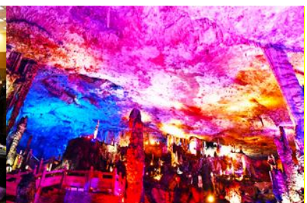
ถ้าเก้าสวรรค์วิวเทียนถั่ง

วันที่สาม เมืองจางเจียเจี๋ย-ศูนย์แพทย์แผนจีน -ศูนย์จำหน่ายผลิตภัณฑ์ยางพารา-ถ้าเก้าสวรรค์-อุทยานฟงเหลียนซี-ล่องเรือธารน้ำหมาเหียนเหอ-เมืองโบราณฝูหรงจิน