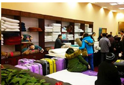
ศูนย์จำหน่ายผลิตภัณฑ์ยางพารา