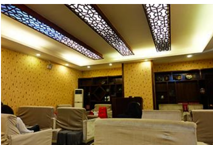
ศูนย์แพทย์แผนจีน

อัตราค่าบริการสำหรับโปรแกรมเสริมการแสดงชุด The love Story of Wooden man and Fairy Fox ท่านละ 400 หยวน (หรือประมาณ 2000.-บาทขึ้นอยู่กับอัตราแลกเปลี่ยน) ระยะเวลาที่ใช้ในการเที่ยวชมการแสดง ประมาณ 3 ชั่วโมง รวมเวลาเดินทางไปกลับค่าบริการรวม ค่าบัตรเข้าชม ค่ารถรับ ส่ง และค่าน้ำทิพย์ของไกด์ท้องถิ่น