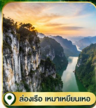
ล่องเรือ เหมาเหียนเหอ