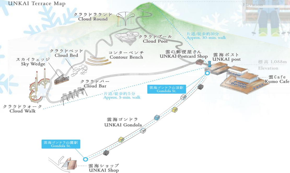
雲海テラスマップ UNKAI Terrace Map

เดินทางสู่ เมืองอาซาฮิคาว่า เป็นเมืองที่ใหญ่เป็นอันดับสองของเกาะฮอกไกโด รองจากนครซัปโปโระมีร้านค้าที่ขายข้าวและผักที่ปลูกได้ในเมือง และยังมีร้านอาหารทะเลตั้งอยู่มากมาย การคมนาคมสมบูรณ์แบบ ทำให้แต่ละปีมีผู้มาท่องเที่ยวกว่า 5 ล้านคนจากทั้งในและต่างประเทศ