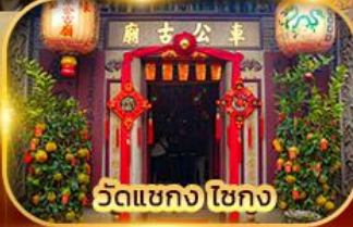
วัดเขกง ไชกง