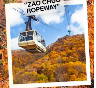
"ZAO CHUO ROPEWAY"

วันเดินทาง 30 ต.ค. - 5 พ.ย. 2569 4 - 10 พ.ย. 2569