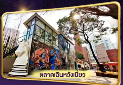
ตลาดเดินหวังเมี่ยว