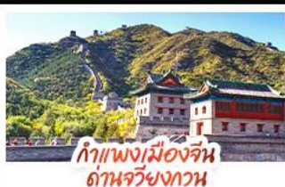
กำแพงเมืองจีน ด้านจวิ๋นกวาน

ส่องเรือสุดโรแมนติกแม่น้ำหวงผู้ ปักกิ่ง..เปิดประตูสู่แดนมังกร ด้วยความอลังการระดับจักรพรรดิ ชิงเต่า..เมืองชายทะเลสไตล์ยุโรป หูรหราบแบบผ่อนคลาย เซี่ยงไฮ้..มหานครแห่งเอเชีย เมืองที่ไม่เคยหลับใหล