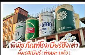
พิพิธภัณฑ์โรงเบียร์ชิงเต่า คิมรสเบียร์ (ทานคะ 1 แก้ว)