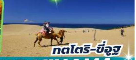
กตโตริ-ขี่อูฐ