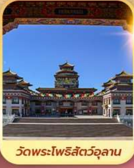
วัดพระโพธิสัตว์อุลาน