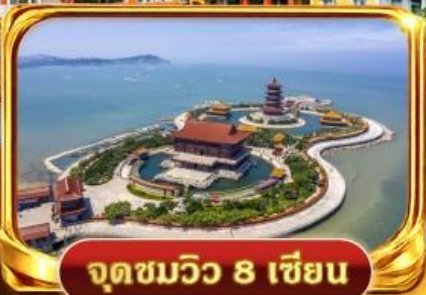
จุดชมวิว 8 เชียง