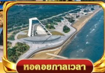
หาดยกาลเวลา