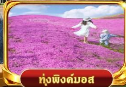
กุงฟิงคิมอส