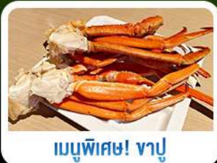
เมนูพิเศษ! ซาซิมิ