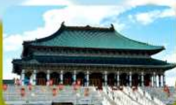
พระราชวังต้องห้ามออร์ดอส