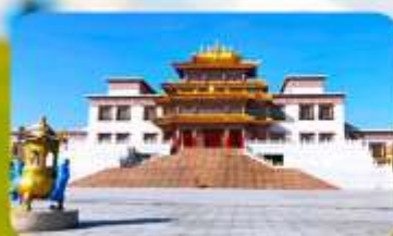
คฤหาสน์พุทธบูชาแห่งชีวีตูลาน