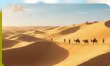
เนินทรายอินเคินทาลา