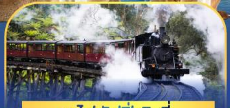
รถไฟพัพฟิงบิลลี่

ล่องเรือชมอ่าวซิดนีย์พร้อมรับประทานอาหารกลางวัน และ เข้าชมสวนสัตว์การองก้า