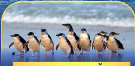
พาเหรดนกเพนกวิน