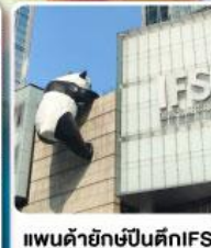
แพนด้ายักษ์ปิ่นตักIFS