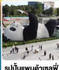
รูปปั้นแพนด้าเซลฟ์