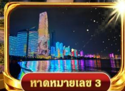
หาดหมายเลข 3