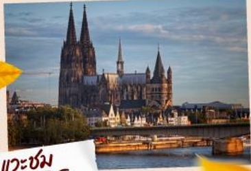
แวะชม มหาวิหารโคโลญ