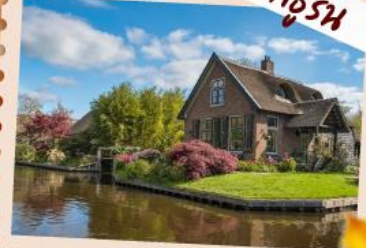
กิลเบิร์น