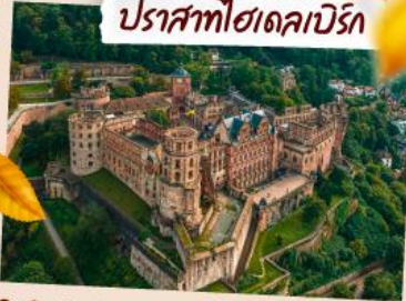
ปราสาทไฮเดคาเบิร์ก