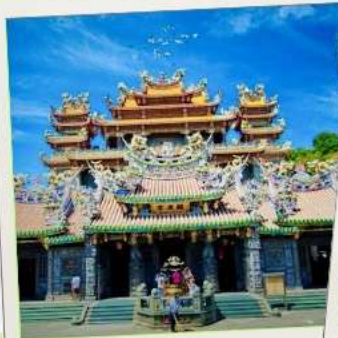
วัดกวนตู่