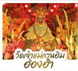
ว้ดเจ้าแม่กวนอิมอ่อ้งอ้่า