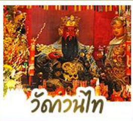
ว้ดกวนน้ท