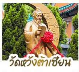
ว้ดแ่ว้งถ้่าเซ้ชง