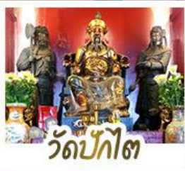
ว้ดป้กไ้ต