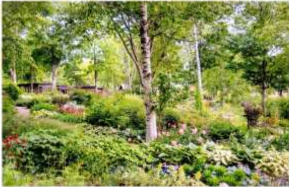
DAISETSU MORI NO GARDEN