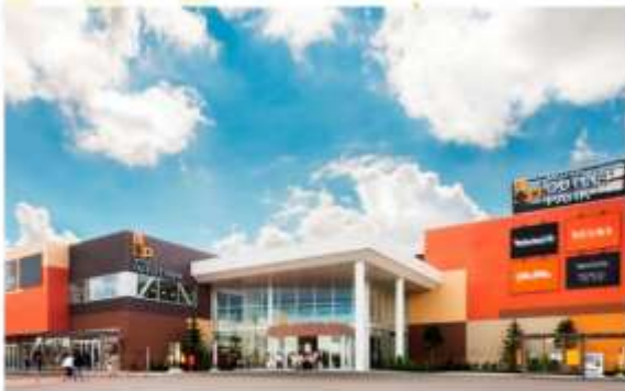
SHOPPING AT KITA HIROSHIMA OUTLET

อิสระอาหารค่ำตามอัธยาศัย (ไม่รวมในรายการ)