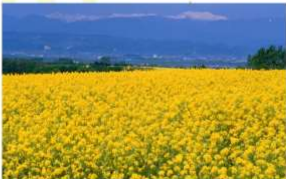
TAKIKAWA NANOHANA FESTIVAL รับประทานอาหารค่ำ ณ กิตตาคาร

อิสระอาหารกลางวัน ภายในหมู่บ้านรามอนอาซาฮิยาม่า (รับเงินคืนจากบัตรเครดิต ค่าเช่า: 3,000 เยน)