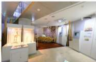
AKAN INTERNATIONAL CRANE CENTER